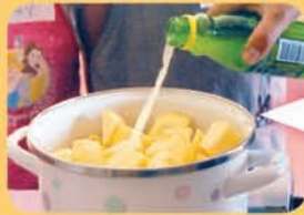
鍋にりんごとレモン汁を入れる。