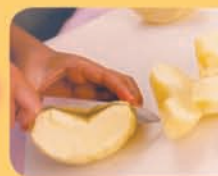
2-3cm (約1inch) 角に切る。