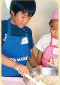
ホットケーキミックスとくるみをを入れてよく混ぜる。