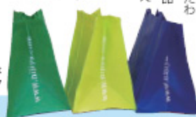
色も豊富なニジャ オリジナル・エコバッグ

ハワイに住んでいらっしゃるお客様をはじめ、観光やビジネスでハワイを訪れる機会のあるお客様もぜひ一度ニジャ・ホノルル店へお越し下さい。いつでもどこでも変わらぬ笑顔と真心でお客様をお迎えしています。ニジャ・ホノルル店をどうぞよろしくお願い致します。