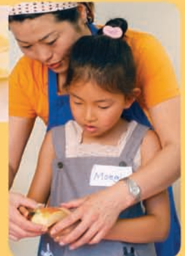
りんごは皮を剥く。(ケガをしないように注意)