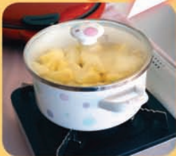
弱火で蓋をして蒸し煮する。焦げないように時々かき混ぜる。