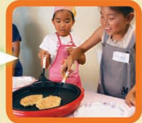
両面が焼けたら、 できあがり!