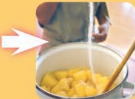
水分がなくなったら味を見て好みに砂糖を加え、よく混ぜる。