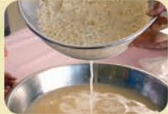
変色を防ぐため、水を張ってザルを入れたボウルに、すりおろしたさつまいもを入れる。