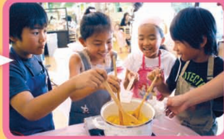
火を止め、少々つぶす。