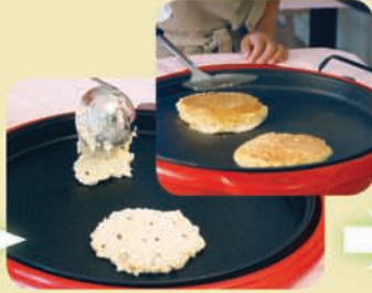
フライパンかホットプレートで焼く。