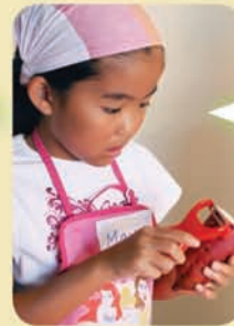
さつまいもはピーラーで皮を剥く。