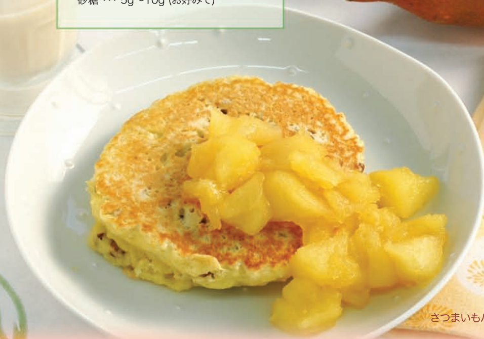
さつまいもパンケーキ・りんごジャム添え