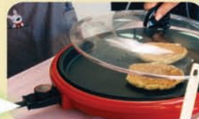
表面がプツプツとなって周りが固まったら裏がえし、蓋をする。